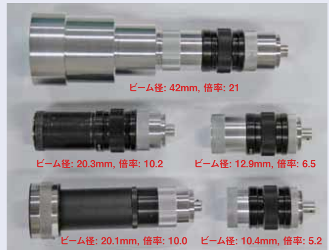
図3●試作した光アンテナ(倍率5.2倍から21倍まで、ビーム直径10mmから42mmまでの5種類)

ここで紹介した手法により、ビーム直径が5cm以下で波長0.8 \mu\text{m} から1.55 \mu\text{m} のレーザ結像光学系を短期間に試作することができそうです。図3の倍率の一番大きな光アンテナについては、試作開発スタッフに複数台の追加製作を依頼し、外部機関との共同研究に使用しました。また、本稿で紹介した光アンテナについては特許出願と共に国際学会でも発表しています。